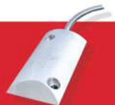
Sensor de Puerta